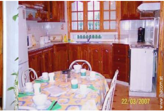
große separate Küche