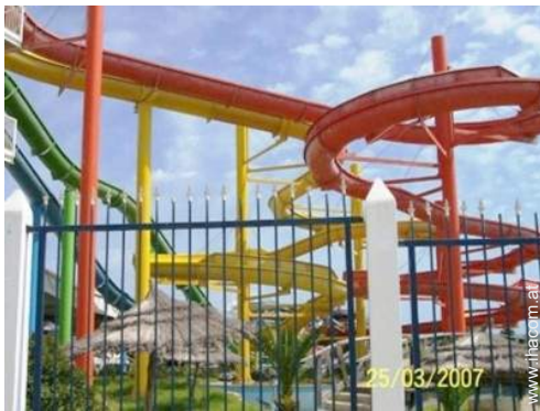
Freizeitaktivitäten in der Nähe