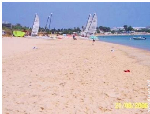
Wassersport in der Nähe