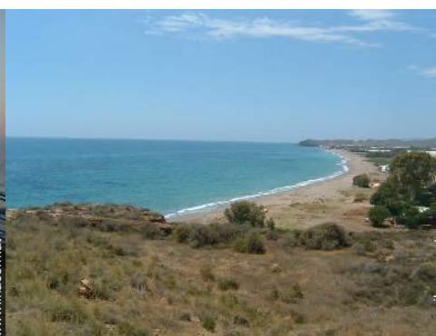
Sommeraktivitäten in der Nähe