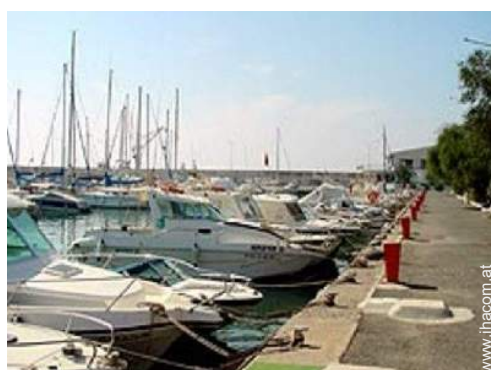
Wassersport in der Nähe