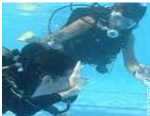
Wassersport in der Nähe