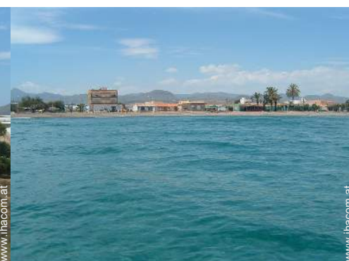
Wassersport in der Nähe