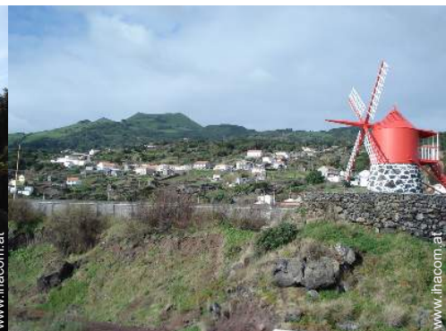
Antiquitäten & Trödel