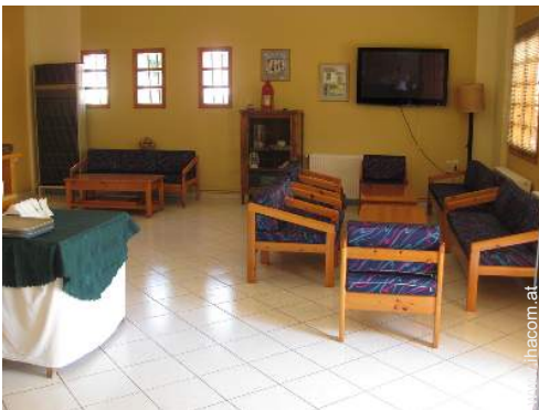
Wi-Fi (drahtloser Internetzugang)