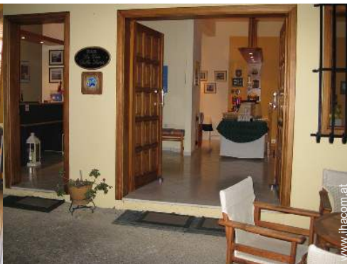
Wi-Fi (drahtloser Internetzugang)