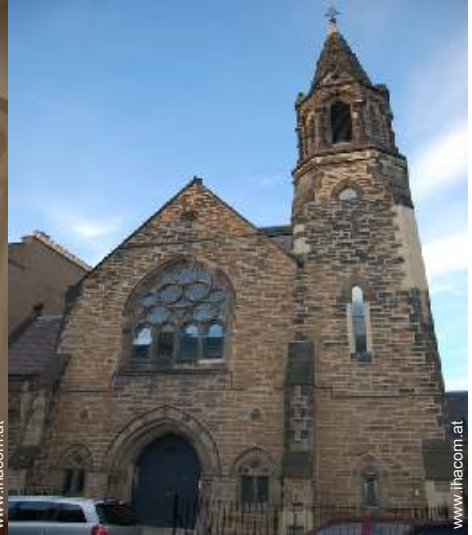
ehem. Kapelle mit Charme