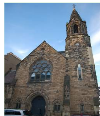
ehem. Kapelle mit Charme