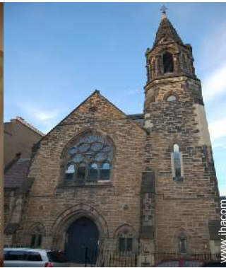
ehem. Kapelle mit Charme