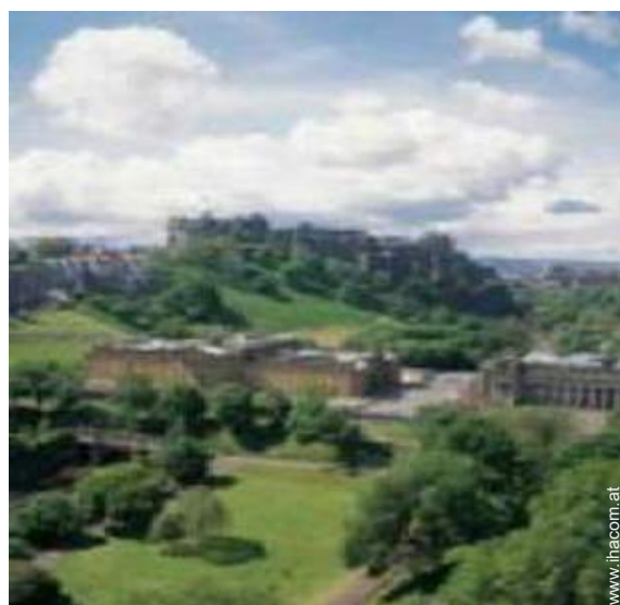
Blick auf Stadtzentrum