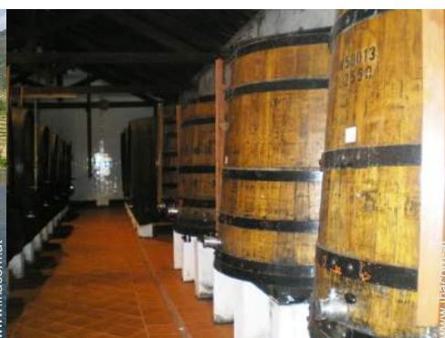
Weinkeller und Weindegustation