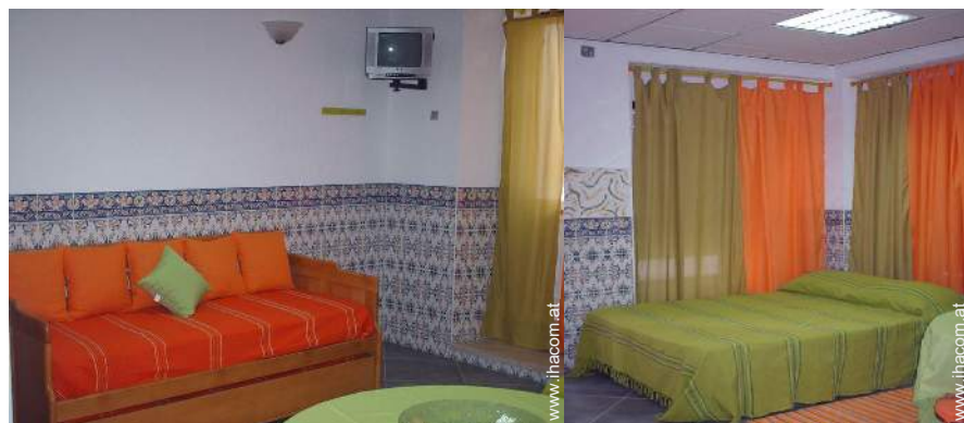
Ausziehbett(en) 1 Person