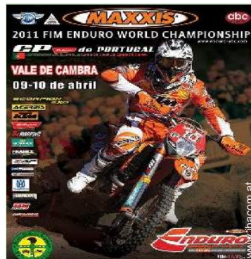
Freizeitaktivitäten in der Nähe