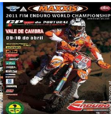
Freizeitaktivitäten in der Nähe