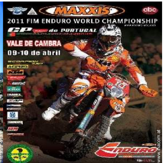
Freizeitaktivitäten in der Nähe