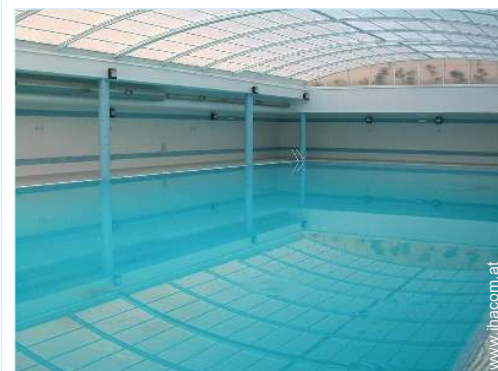
Swimmingpool im Haus