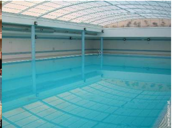
Swimmingpool im Haus