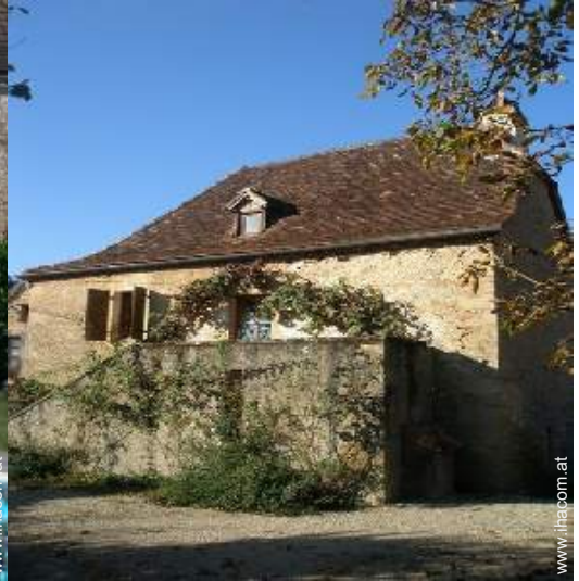
Charakterhaus mit Charme