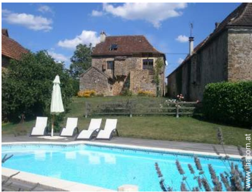
Charakterhaus mit Charme