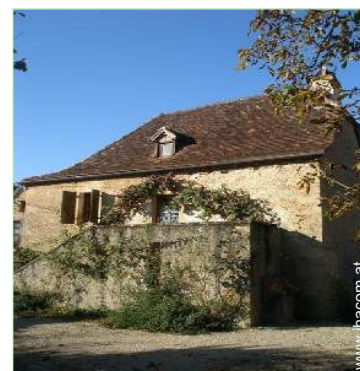
Charakterhaus mit Charme