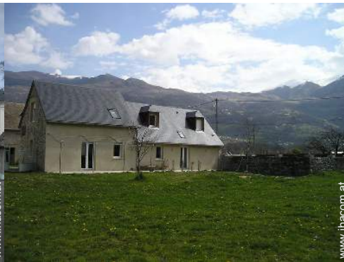
Blick auf Wiese