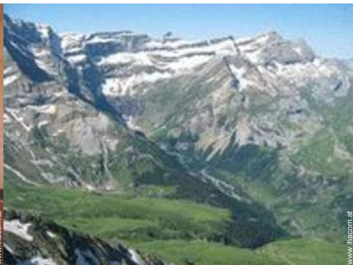
Gebirgsaktivitäten in der Nähe