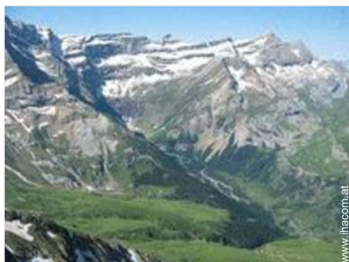
Gebirgsaktivitäten in der Nähe