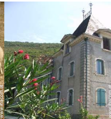
Außerer Rahmen zur Verfügung der Gäste