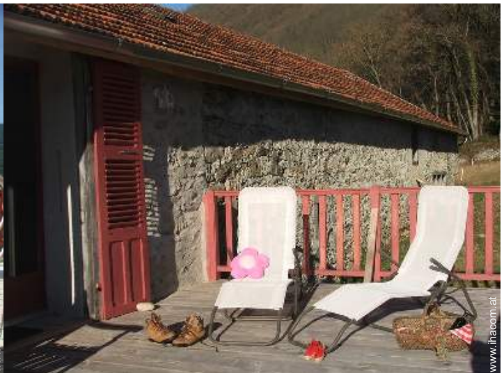
Steinhaus mit Charme