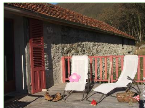
Steinhaus mit Charme