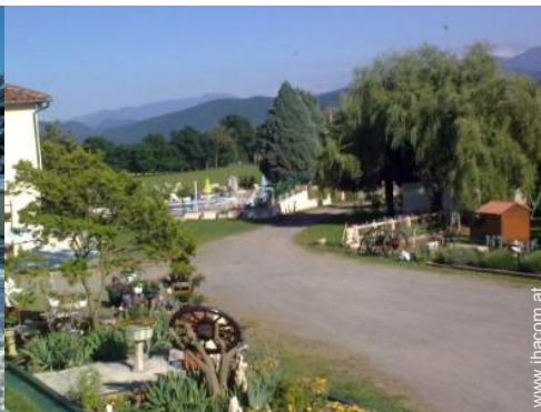
Blick auf Gebirge