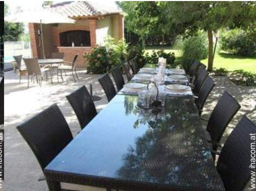
Außenausstattung zur Verfügung der Gäste