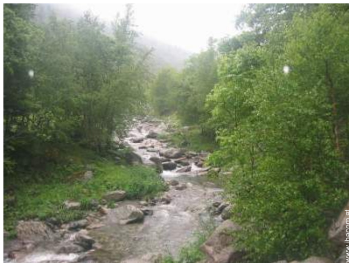
Blick auf Fluss