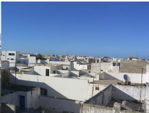
Blick auf Dächer