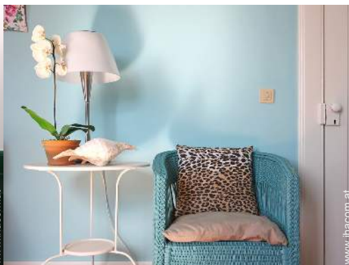
Villa mit Charme