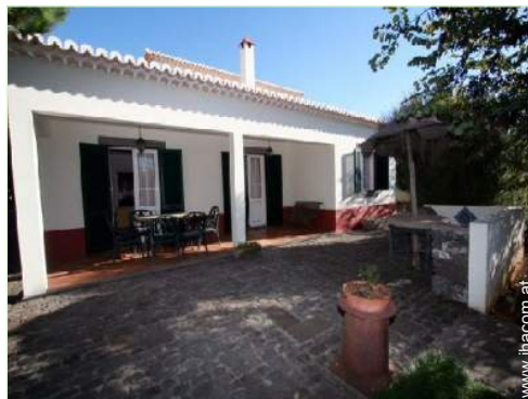
Außenanlage zur Verfügung der Gäste

Rollstuhlgerechter Zugang Behindertengerecht für : motorisch Behinderte