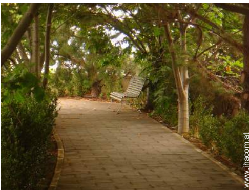
Äußerer Rahmen zur Verfügung der Gäste