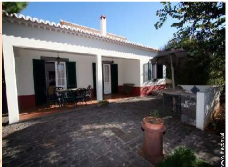
Außenanlage zur Verfügung der Gäste