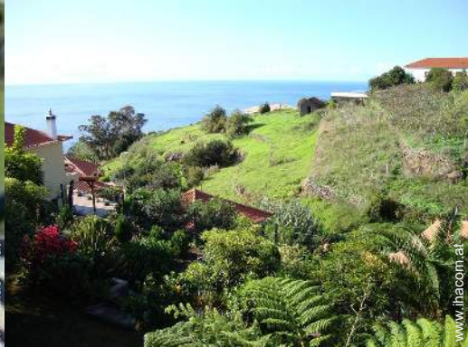
Blick auf Ozean