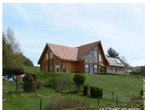
Le Chalet en entier