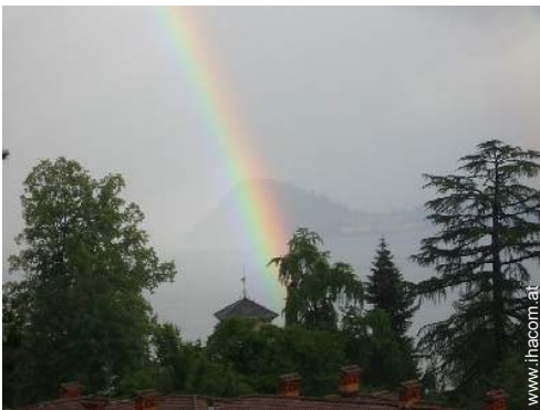
Blick auf See