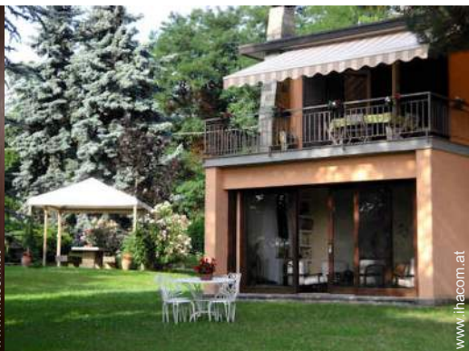
Villa mit Charme