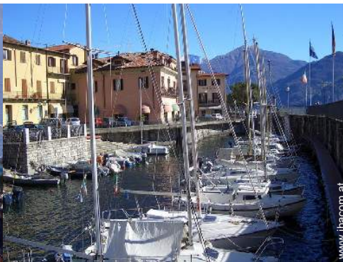
Helling für Boote