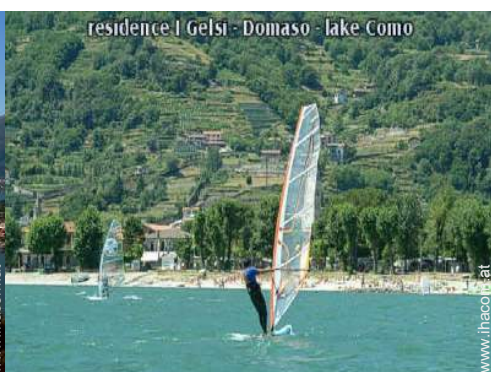
residence I Gelsi - Domaso - lake Como