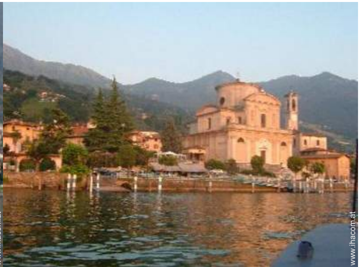
Blick auf Dorfzentrum