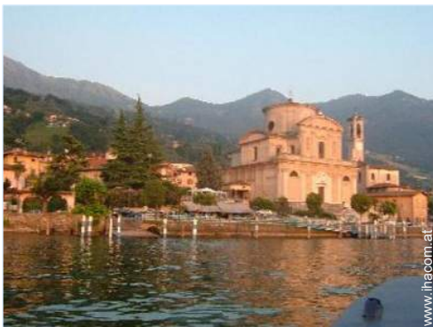
Blick auf Dorfzentrum