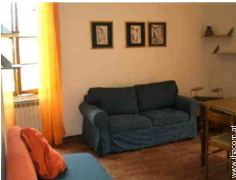
Sofabett(en) 2 Personen