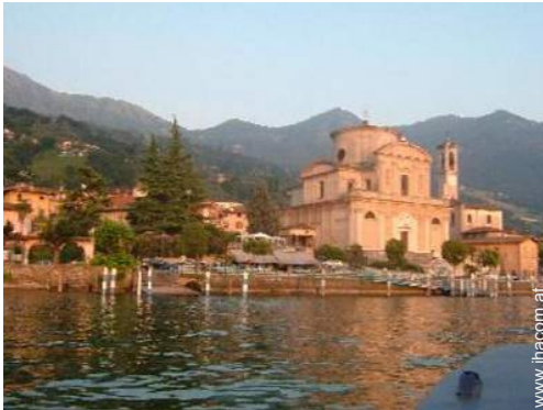
Blick auf Dorfzentrum