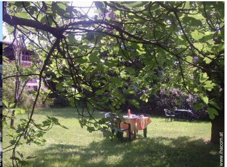
Park und Garten