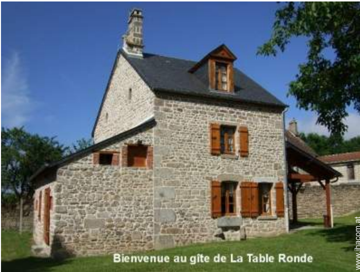
Bienvenue au gîte de La Table Ronde