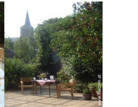
Blick auf Denkmal