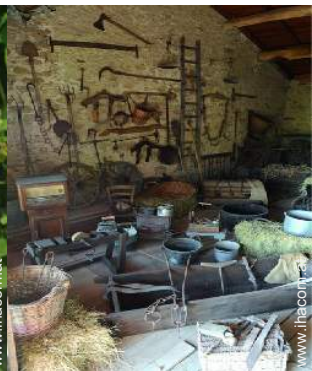
Antiquitäten & Trödel