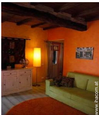
Sofabett(en) 2 Personen