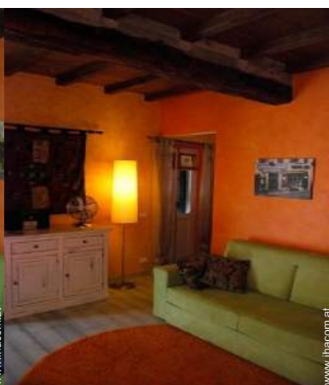
Sofabett(en) 2 Personen