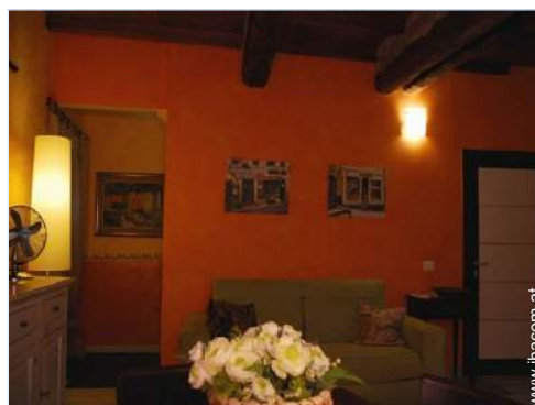
Sofabett(en) 2 Personen