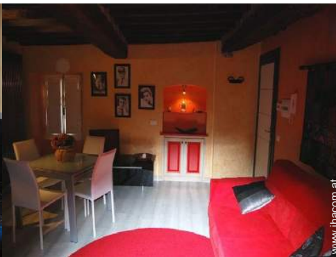
Sofabett(en) 2 Personen