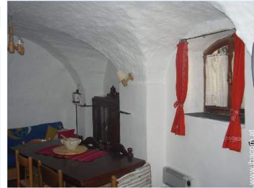
große separate Küche