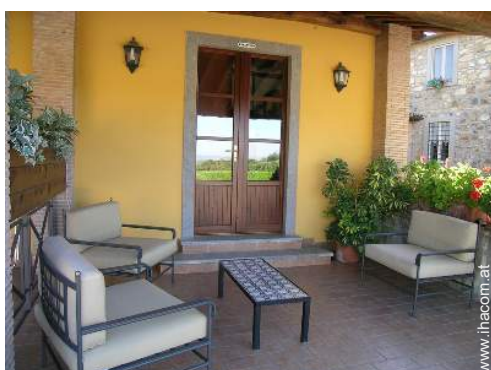
Außenausstattung zur Verfügung der Gäste