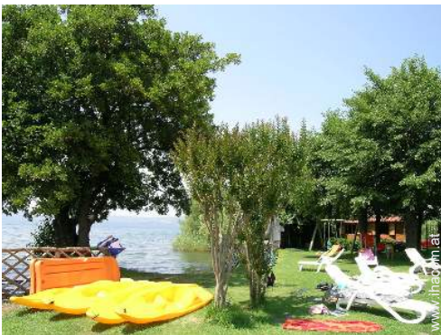
Außenausstattung zur Verfügung der Gäste