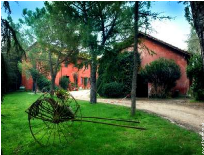
ehem. Bauernhof mit Charme