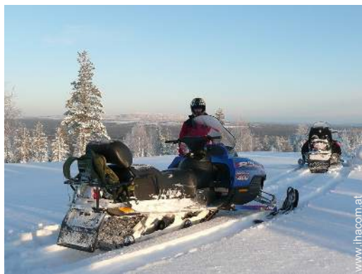
Winteraktivitäten in der Nähe