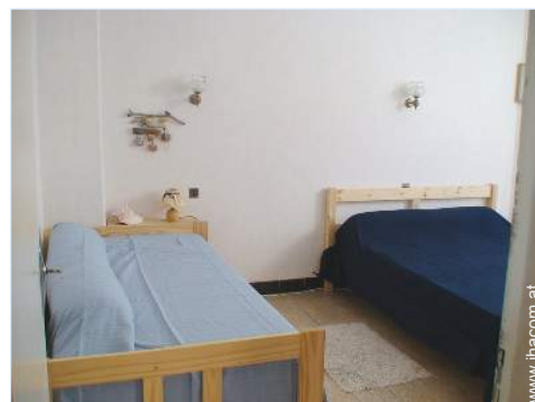
Schrankbett(en) 2 Personen