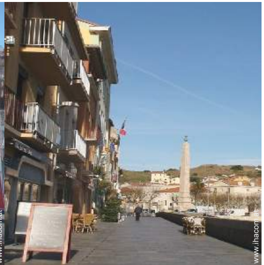
Blick auf Fußgängerzone