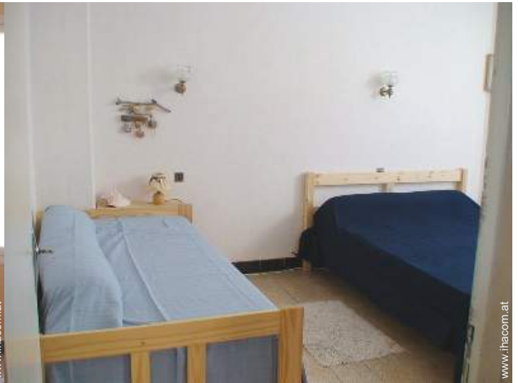
Schrankbett(en) 2 Personen