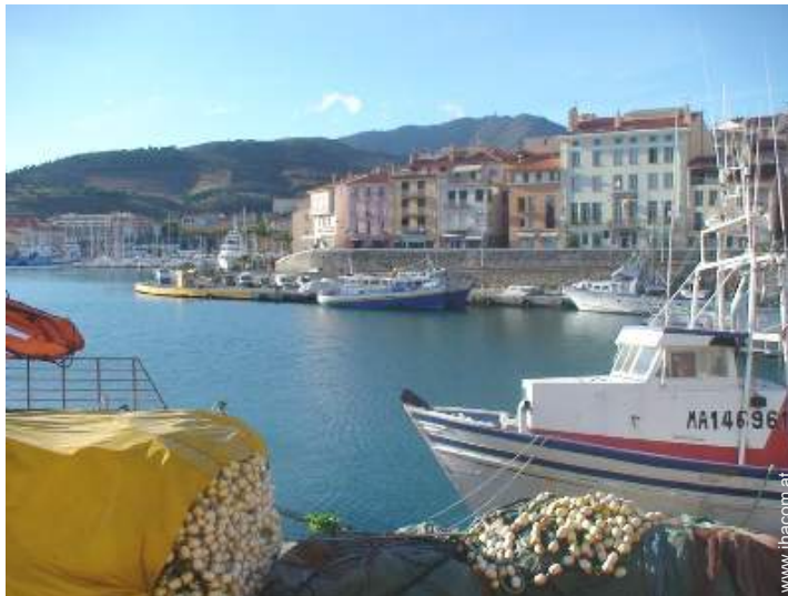
Blick auf Hafen