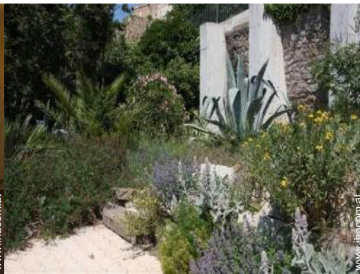
Blick auf Garten/Park