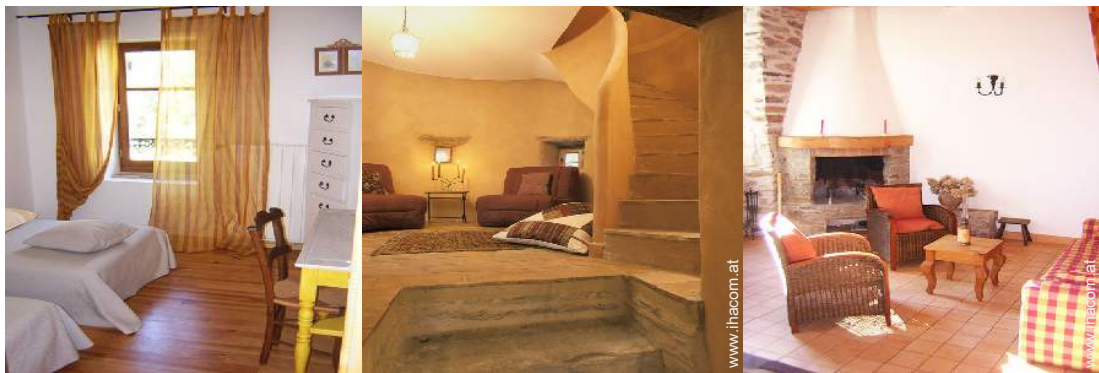
Sofabett(en) 1 Person