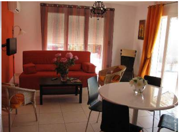
Innenkomfort zur Verfügung der Gäste