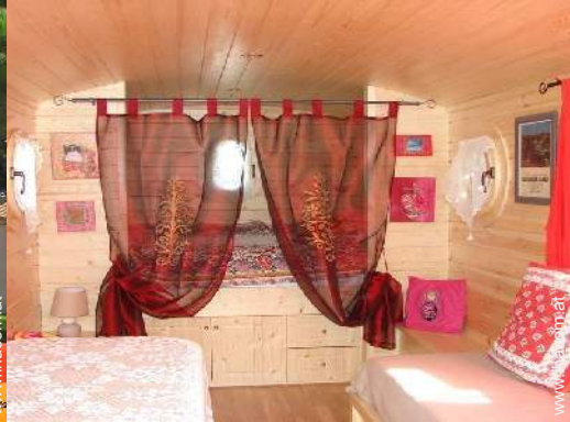
Wohnwagen mit Charme