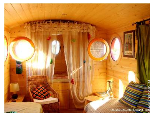
Wohnwagen mit Charme