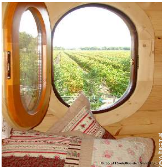
Blick auf Weinberge