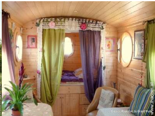
Wohnwagen mit Charme