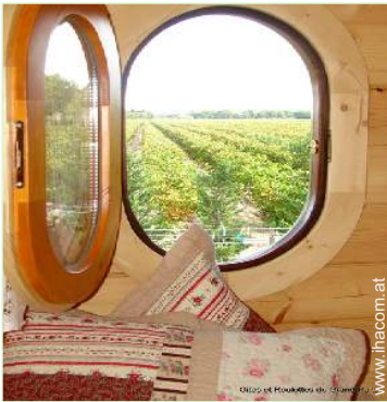
Blick auf Weinberge