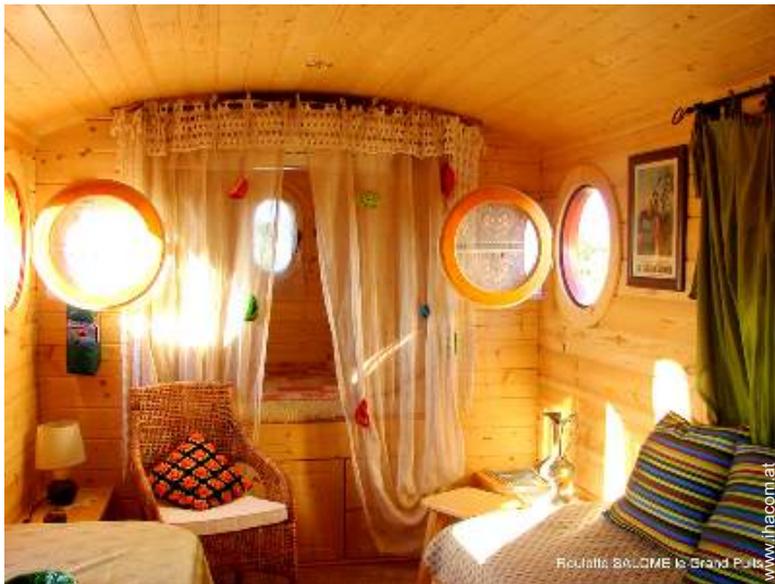
Wohnwagen mit Charme