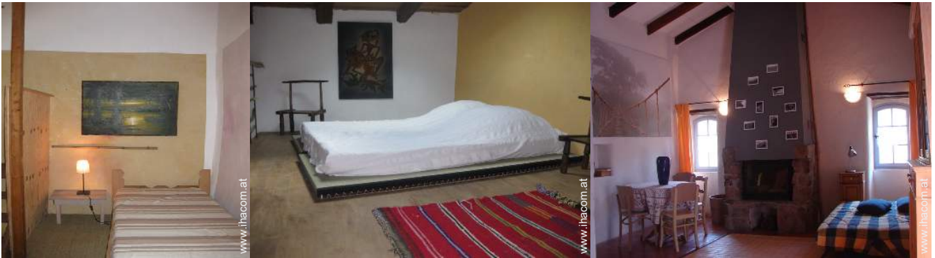
Futon(s) 2 Personen