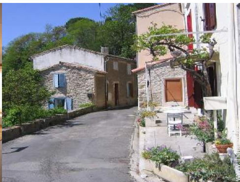
Cottage mit Charme