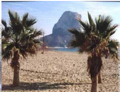
Badevergnügen in der Nähe