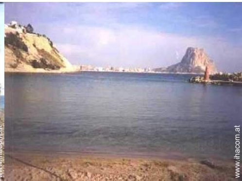
Badevergnügen in der Nähe