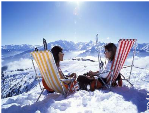
Freizeitaktivitäten in der Nähe