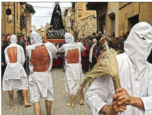
Nah gelegene Städte