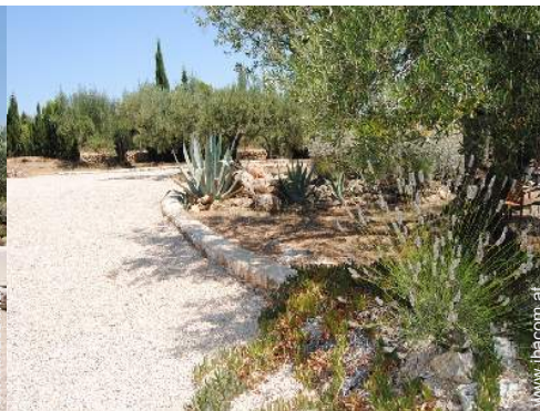
Äußerer Rahmen zur Verfügung der Gäste