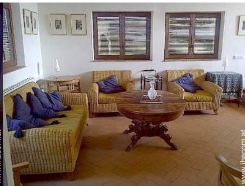
Raumaufteilung zur Verfügung der Gäste