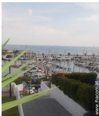
Blick auf Hafen