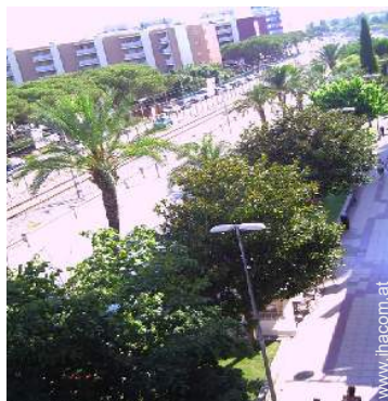
Blick auf Straße/Avenue